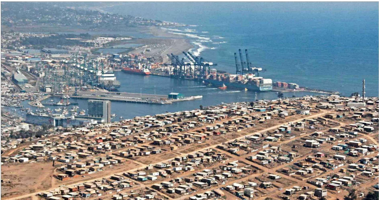
Figura 1: Vista del macrocampamento Centinela en el Cerro la Virgen, encima del Puerto de San Antonio. Fuente: Jonathan Mancilla /El Mercurio, el 7 de julio de 2023.