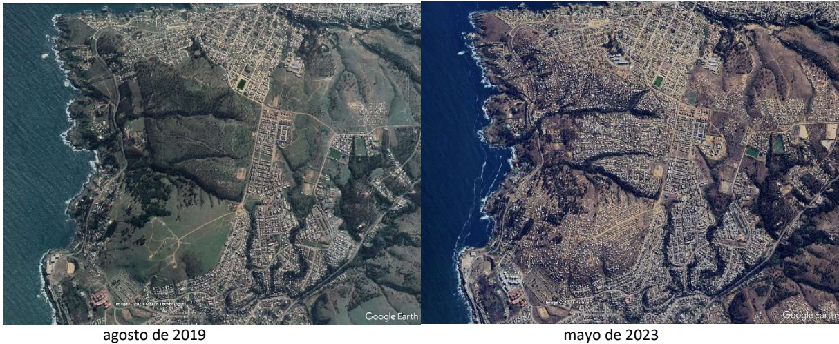
Figura 2: Forma de ocupación de los terrenos en el área de conurbanización entre San Antonio y Cartagena.