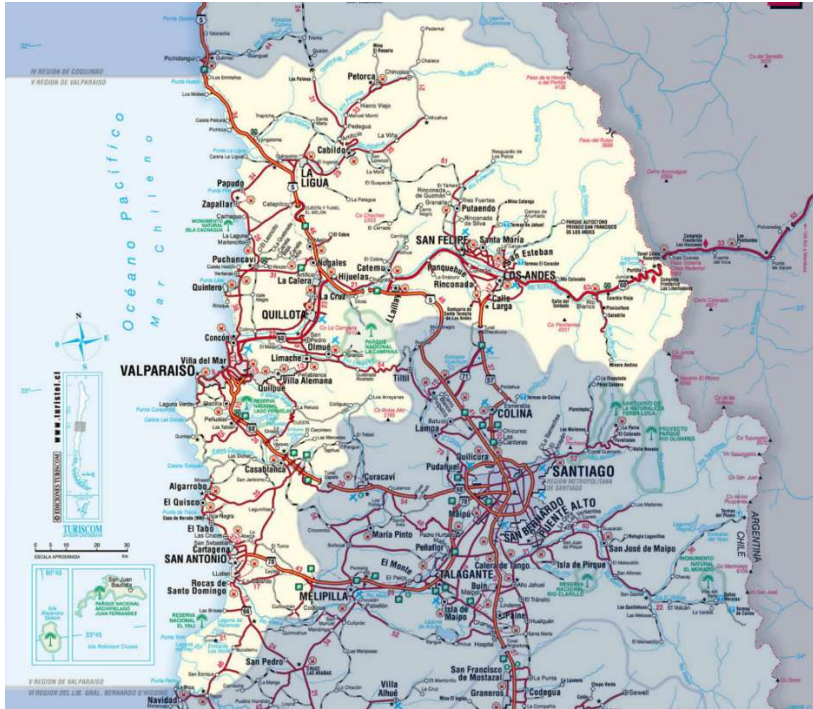
Figure 4: Mapa de la Región de Valparaíso, con las ciudades de San Antonio y Cartagena en la parte sur poniente.